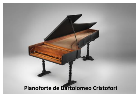
Pianoforte de Bartolomeo Cristofori

Piano , (apócope derivado del italiano pianoforte) es un instrumento de teclado de cuerdas percutidas. Está compuesto por una caja de resonancia, a la que se ha agregado un teclado, mediante el cual se percuten las cuerdas de acero con macillos forrados de fieltro produciendo el sonido. Las vibraciones se transmiten a través de los puentes a la tabla armónica, que los amplifica. Fue inventado en torno al año 1700 por el paduano Bartolomeo Cristofori.