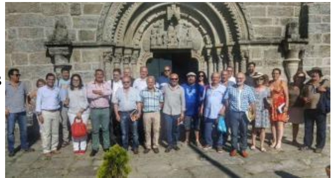
Imagen de los integrantes de "Vía Mariana" en la primera reunión en A Franqueira.

Una ruta que une los principales santuarios marianos desde Braga hasta Muxía nace como "eje dinamizador sociocultural y económico de las Terras de Montes. Bajo el nombre de "Vía Mariana", la iniciativa aspira a crear una gran ruta de peregrinación mariana entre Galicia y Portugal.